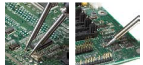
Die Präzisionspinzette eignet sich für das Rework von SMD-Bauelementen - vom kleinsten Chip-Bauteil bis zu großen SOICs. Der Lötspitzen-Lötgriffel bietet Leistungsreserven für das Produktionslöten.