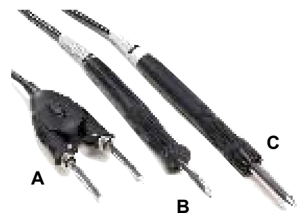
Handstücke für die Serie MFR-2200 A. MFR-H4-TW Präzisionspinzette B. MFR-H2-ST Lötspitzen-Lötgriffel C. MFR-H1-SC Lötpatronen-Lötgriffe